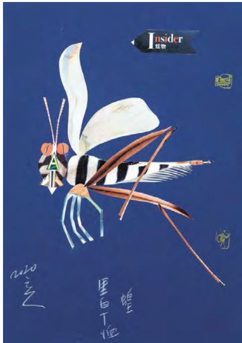
Locust in Black And White T-shirt [Criquet en T-shirt noir et blanc], 2020, crayon de couleur et collage sur papier, 42 × 29,6 cm Courtesy of Power Station of Art

Toutes les images : Atelier de numérisation – Ville de Lausanne (AN)