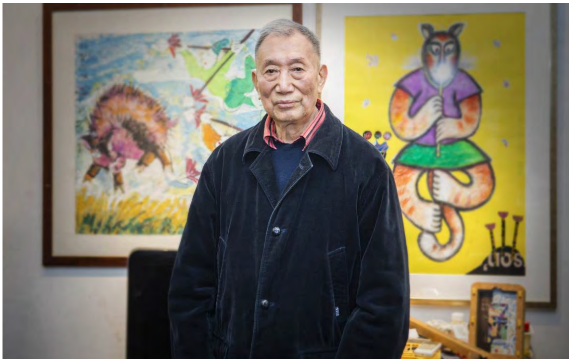
Portrait de Ding Liren.