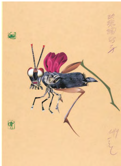
Rose Silk Locust [Criquet rose soie], 2019, crayon de couleur et collage sur papier, 42 × 29,6 cm