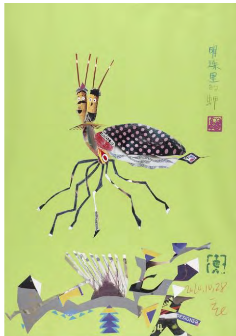
Beetle of Mingzhuli [Scarabée de Mingzhuli], 2020, crayon de couleur et collage sur papier, 42 × 29,6 cm