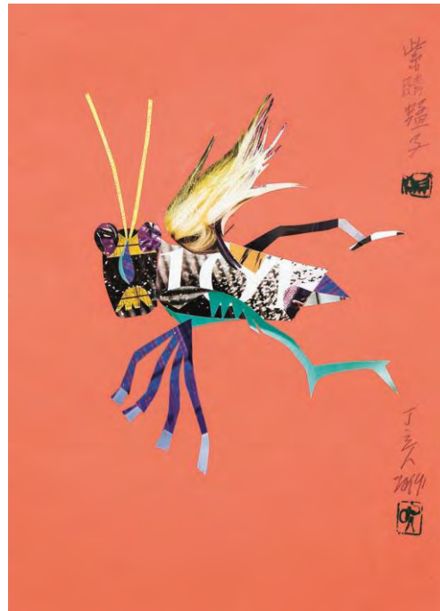
Purple-eyed Locust [Criquet aux yeux violets], 2019, crayon de couleur et collage sur papier, 42 × 29,6 cm